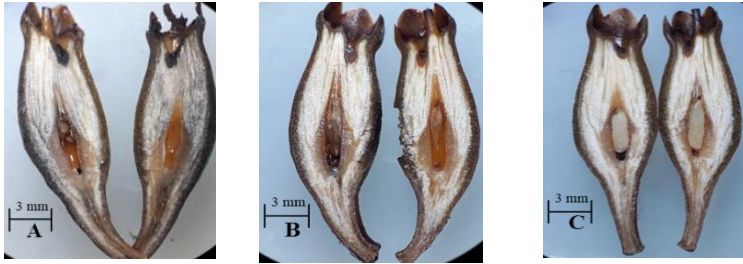
Hình 3.29. Các dạng hạt trong quả Cóc đỏ

phát triển hạt đã có sự tiêu giảm số lượng phôi Cóc đỏ do noãn không được thụ tinh hay không cung cấp đủ chất dinh dưỡng cho phôi phát triển.